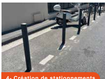
4- Création de stationnements 2 roues motorisés

Suppression du stationnement trottoir-chaussée le long de l'école (rue Jean Mermoz)