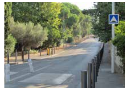
6 - Régulation du stationnement 1 ère partie rue Cdt Rolland