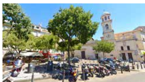
Aménagement des espaces Notre-Dame du Mont

Une réunion de concertation a réuni les habitants en juin 2023, le projet de réaménagement final sera présenté en octobre 2023. La place de l'Honnêteté sera rénovée début 2024.