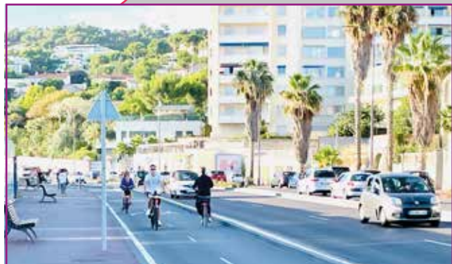
Sécurisation des pistes cyclables Promenade George Pompidou