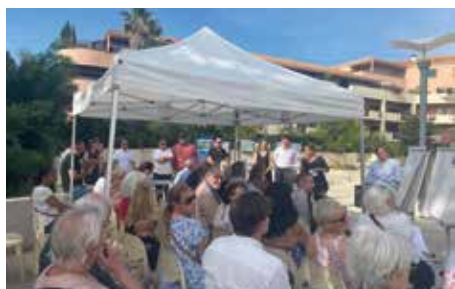
Consultation citoyenne Honnêteté / Muselier

La consultation a réuni les habitants trois fois durant l'hiver 2022-2023 et a permis d'imaginer un nouveau cœur de quartier. Des études techniques seront conduites en 2023 et 2024 par la Métropole.