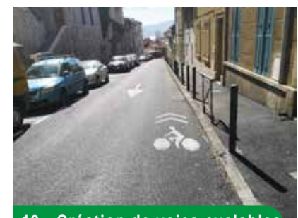
10 - Création de voies cyclables rues Guadeloupe & Milly

sécurisation et créations de nouvelles pistes cyclables sur l'ensemble du secteur, et piste 1 du plan vélo prolongée avenue George Pompidou