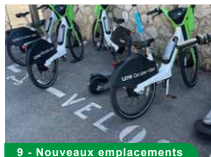
9 - Nouveaux emplacements vélos & trottinettes

Limitation du stationnement anarchique par enrochements sur la route des Goudes, limitation d'accès et de parking Rue Pelleprat et parking de la Maronaise.