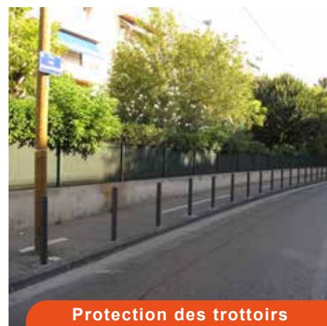
Protection des trottoirs Rue Raphaël Ponson