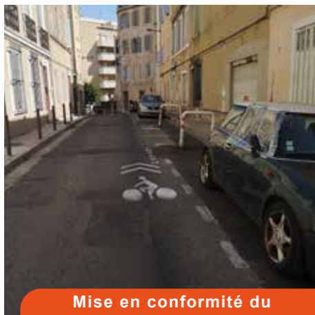
Mise en conformité du stationnement rue Guadeloupe