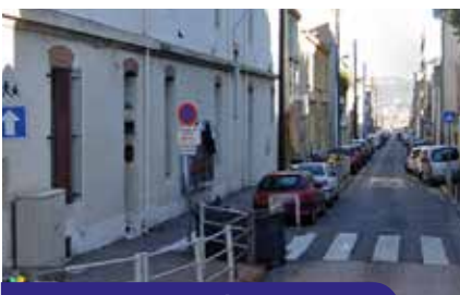
2 - Parvis de l'école Guadeloupe