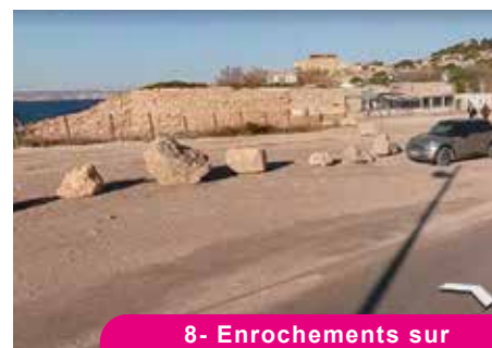
8- Enrochements sur la route des Goudes

Piste cyclable protégée, arbres et bancs