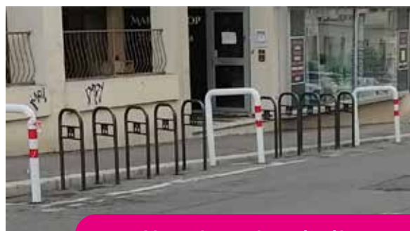
Ajout de stations à vélos