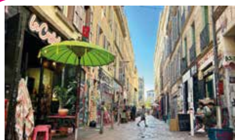
Piétonnisation du Cours Julien

Consultés, les habitants se sont exprimés pour une piétonnisation du parvis de l'église Notre-Dame du Mont ainsi qu'un apaisement de la place Paul Cézanne et de la rue d'Aubagne incluant une piétonnisation partielle. Des bancs, de la place pour les enfants, une limitation des terrasses et une végétalisation renforcée font également partie des travaux à l'étude.