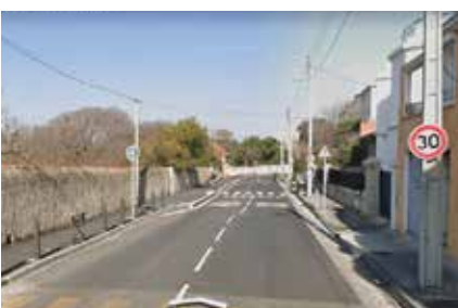
5- Limitation de la vitesse avenue Clot Bey

Place Delibes, Cours Julien, Notre-Dame du Mont