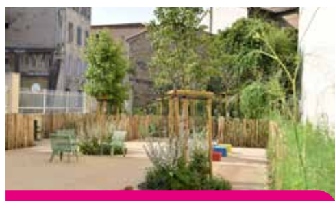
Création du jardin du Réservoir

A l'entrée de cette zone piétonne, des arceaux vélos et un parking dédié aux deux-roues motorisés sont déjà installés.