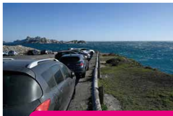
Stationnement sur littoral sud