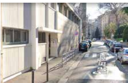
3 - Parvis de l'école Jeanne d'Arc

Sécurisation et ralentisseur au carrefour