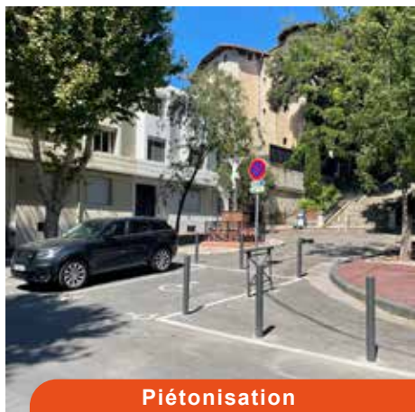
Piétonisation place Emile Sicard

Cette mise en conformité progressive continuera et elle sera structurée en concertation avec le Comité de suivi du Plan Piéton.