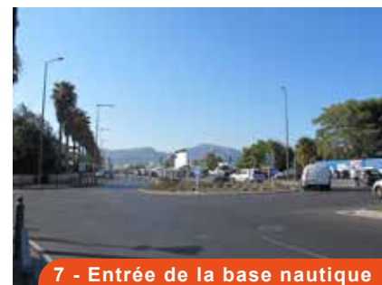
7 - Entrée de la base nautique Promenade G. Pompidou

Quartiers Prado plage et Saint Giniez (Rues Commandant Rolland - Alexandre Dumas - Raphaël Ponson & boulevard Barral)