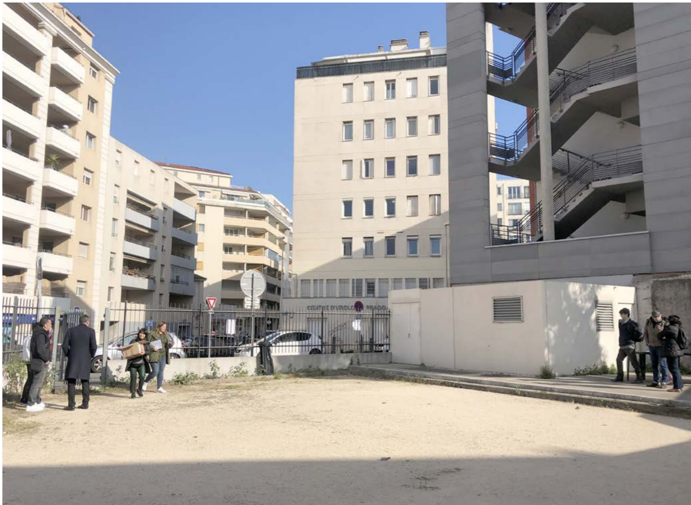
Photos de l'atelier 1