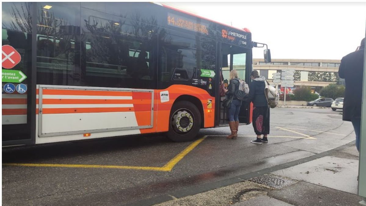
Arrêt du 44 au sein de la place