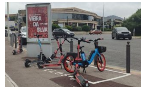
Emplacements EDPM libre service

2 emplacements pour les vélos et trottinettes en libre service