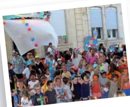
Les Fêtes de l'été dans nos Centres Aérés Juillet - août 2014