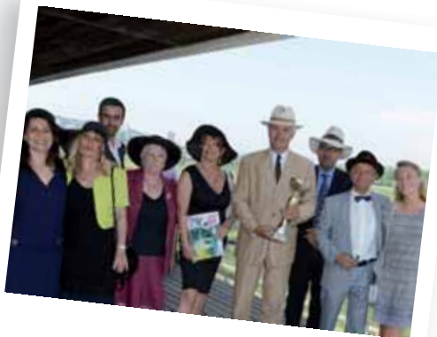
La Mode aux Courses 24 juin 2014 - Hippodrome Borély