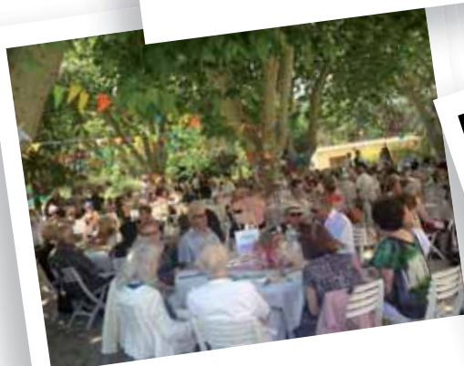
Le Printemps des aînés 12 et 13 juin 2014 - Château Pastré