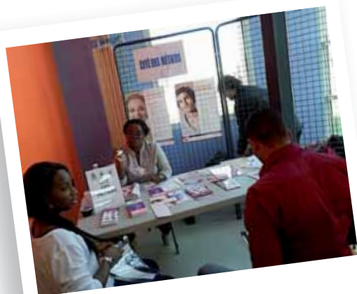
Jobs d'été - Mai 2014 Maison des Sports de Bonneveine