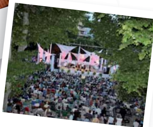
Musiques à Bagatelle 20, 21, 26 et 27 juin 2014