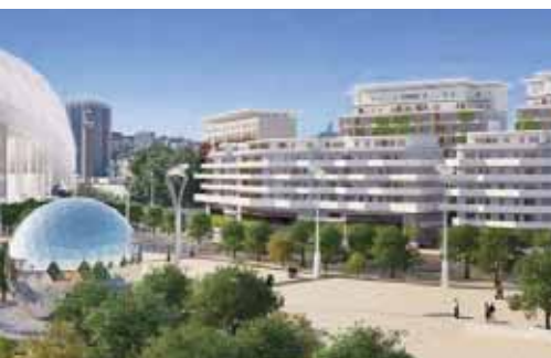
La clinique Monticelli Vélodrome

Plus que jamais, le quartier Vélodrome rendra les habitants de cette ville « fiers d'être marseillais ».