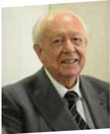
Jean-Claude Gaudin Maire de Marseille Sénateur des Bouches-du-Rhône