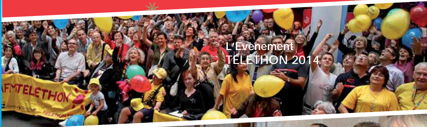
L'Evènement TÉLÉTHON 2014