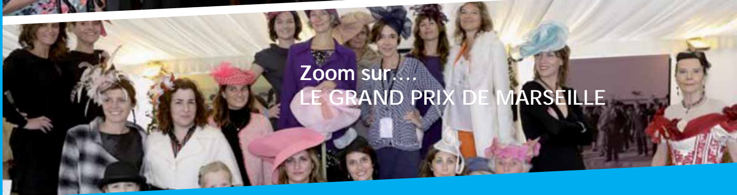
Zoom sur.... LE GRAND PRIX DE MARSEILLE