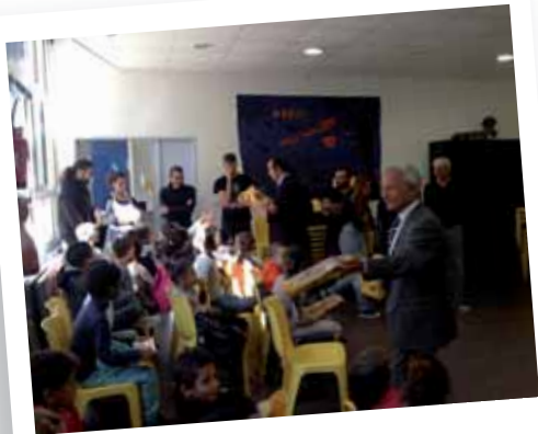
Distribution des brioches de la Chrysalide au Centre Aéré de Castellane 24 octobre 2014