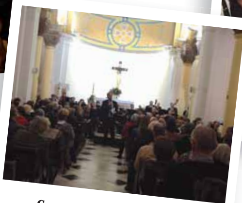
Concert caritatif en faveur des Chrétiens d'orient Eglise Sainte Eusébie - 20 novembre 2014