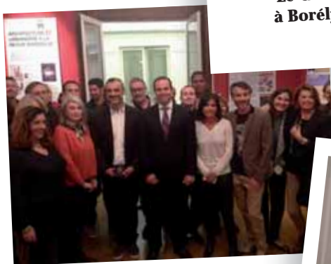
Réception en l'honneur des Commerçants de la Butte - 3 novembre 2014