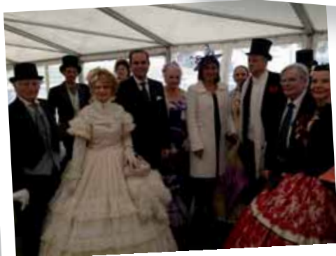
Le Grand Prix de Marseille à Borély - 9 novembre 2014