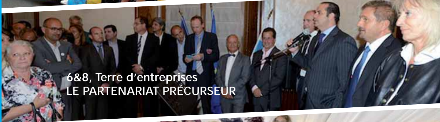
6&8, Terre d'entreprises LE PARTENARIAT PRÉCURSEUR