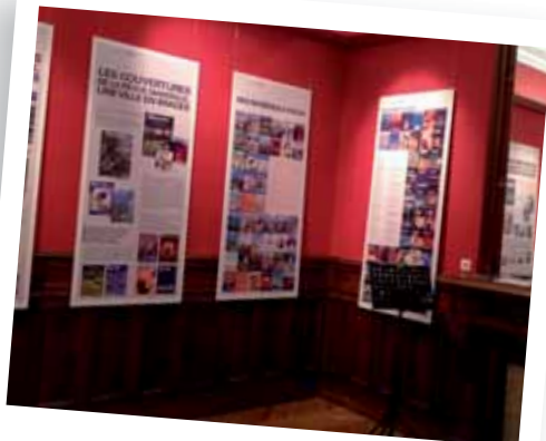
Exposition La Revue de Marseille à Bagatelle - Novembre 2014