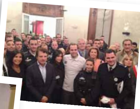
Réception en l'honneur de la brigade VTT centre-ville 18 novembre 2014